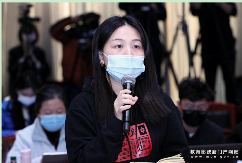
人民日报记者提问。