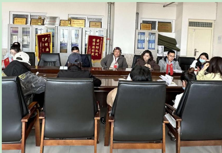
图 艺术学院 毕业论文（设计）中期检查评审会

最后，院长郭国锋表示要充分发挥毕业（设计）中期检查的作用，通过检查发现问题，及时解决。同时推进毕业设计进度，保障毕业设计质量。