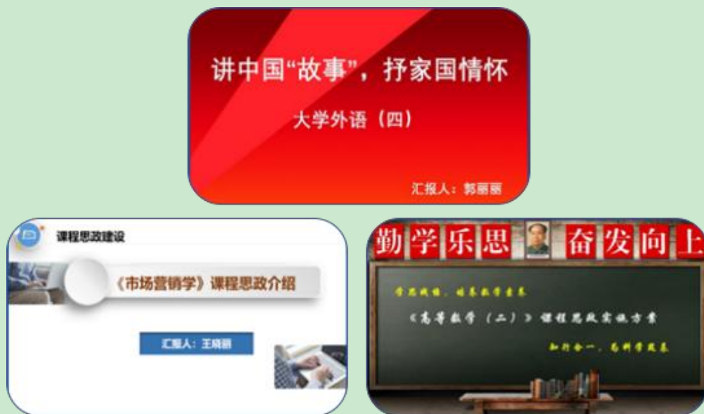
图 1 教师参赛作品

近日，由河北省教育厅主办，河北师范大学、高等教育出版社共同承办的首届河北省课程思政教学竞赛决赛成功落下帷幕。我校推荐晋级省赛的马克思主义学院郭丽丽、展正然和管理科学与工程学院王晓丽三位教师分获两项二等奖、一项三等奖的佳绩。