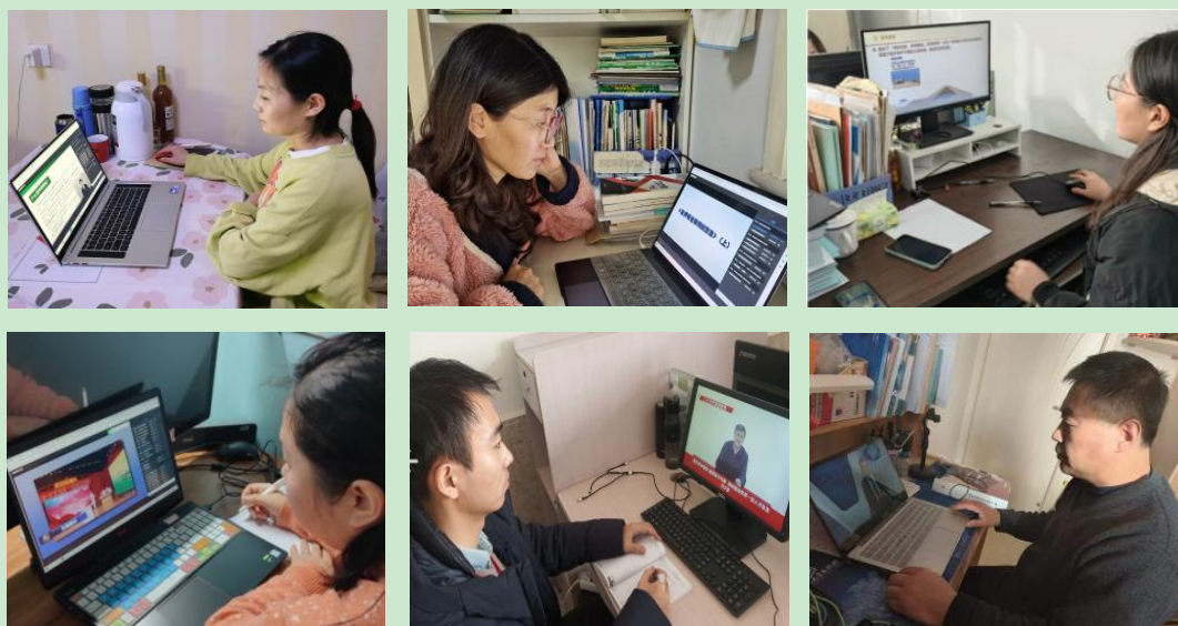
图 2 教师线上培训情况

能的使用等，提高教师的防范意识和处置有关问题的能力。了解直播在线教学中违法犯罪的法律责任，维护合法权益的途径，以及教师在直播教学中应遵守的法律规范。学习怎样面对直播教学中网络暴力等行为，获得心理援助的途径等，降低有关问题对教师身心健康的影响。疫情催生了在线教学，通过课程学习提高了教师应对信息化和常态化在线教学的技术与能力。