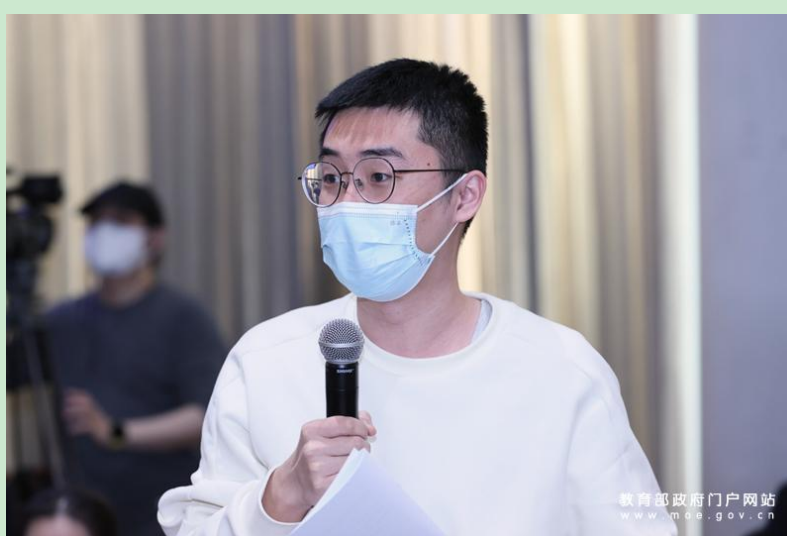
中国教育报记者提问。