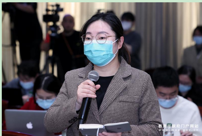
澎湃新闻记者提问。