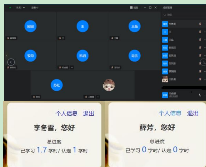
图 1 线上会议与平台注册情况