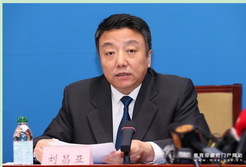
教育部发展规划司司长刘昌亚介绍 2022 年全国教育事业发展的基本情况。